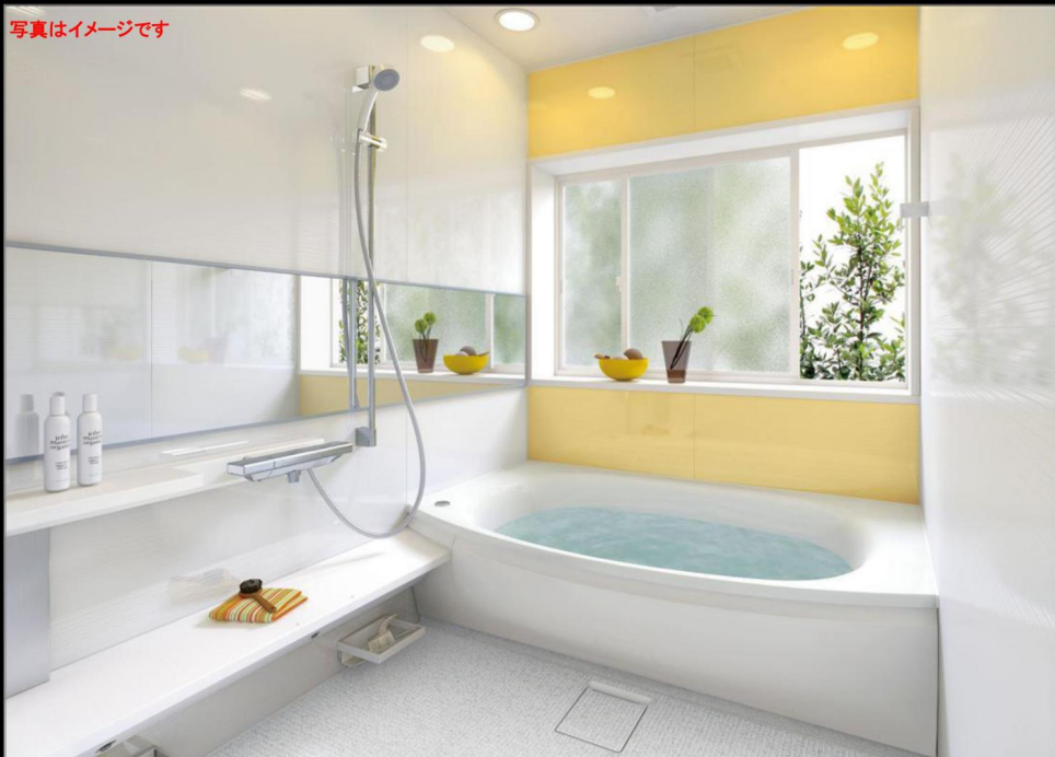
サザナ スタイル 1616サイズ HDV1616USX4※※